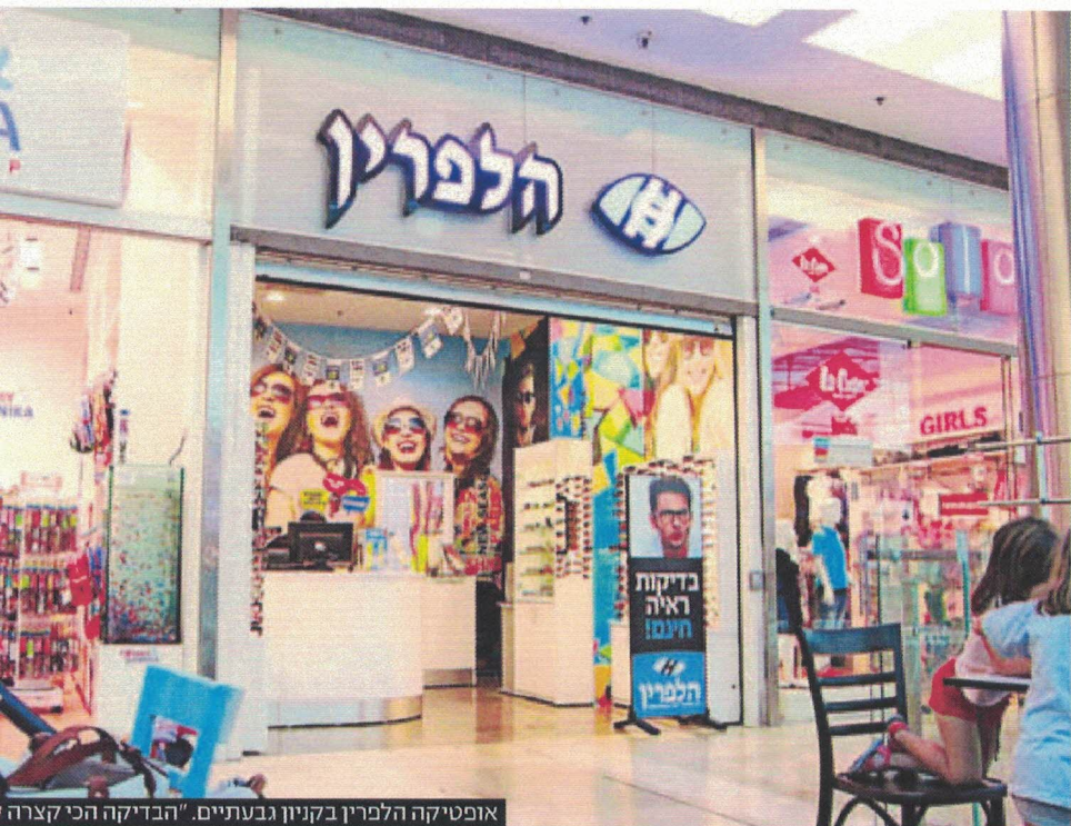
אופטיקה הלפרין בקניון גבעתיים. "הבדיקה הכי קצרה"