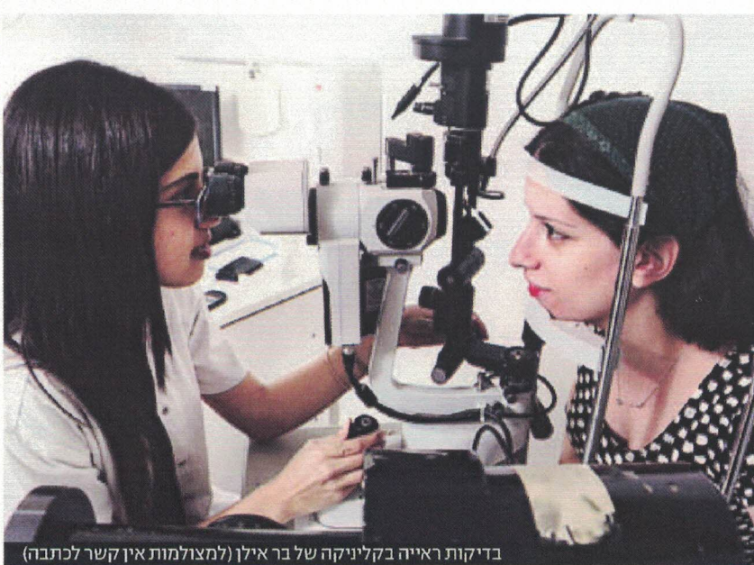
בדיקות ראייה בקליניקה של בר אילן (למצולמות אין קשר לכתבה)

• יעל (שם בדוי): בת 50, מזכירה, לא קצרת ראייה אבל זקוקה למשקפי קריאה, מבלה שעות רבות מול המחשב. ד"ר גוגנהיים המליץ לה לעשות משקפי קריאה חודשים, להשתמש במשקפיים הישנים מול המחשב, ולא לעשות משקפי מולטיפוקל בשלב זה. הוא המליץ לה גם לבקר אצל רופא עיניים לבדיקות נוספות. לעומת זאת, ברשת אחת ניסו לשכנע אותה לרכוש משקפי מולטיפוקל. המרשמים שניתנו לה היו אמנם טובים, אבל אף אחד מהאופטומטריסטים לא המליץ לה לבקר אצל רופא עיניים.